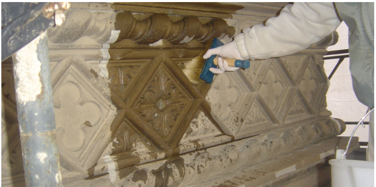
Bagnatura del campione per la verifica dei tempi di esecuzione