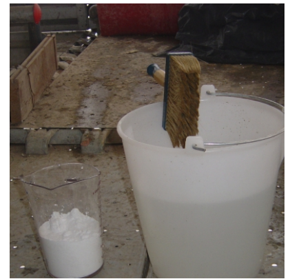
Preparazione delle soluzioni per la pulitura