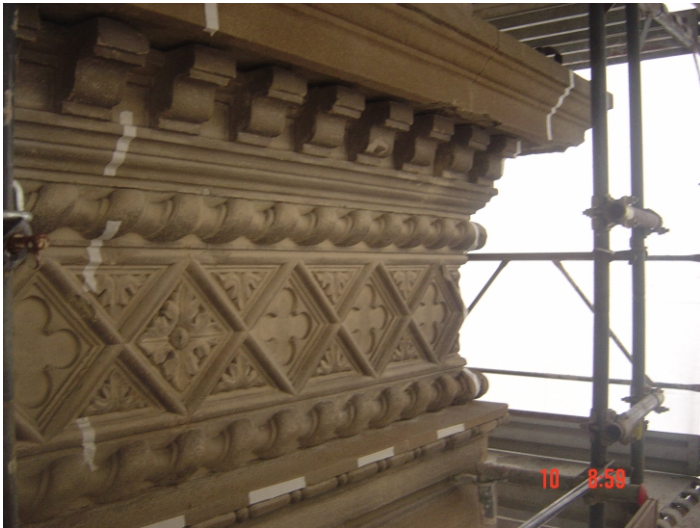
Stato di fatto prima dell'intervento