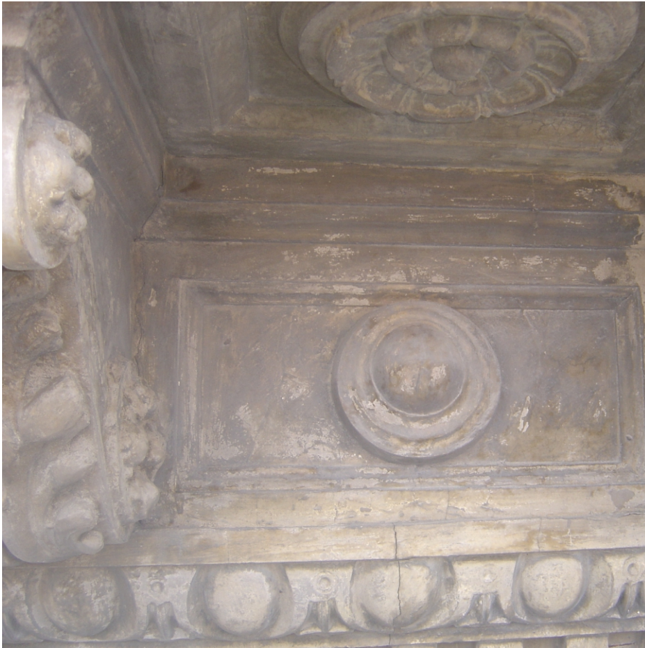
Zona del cornicione prima dell'intervento