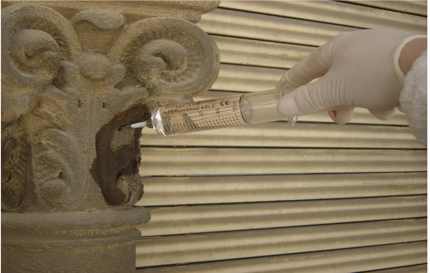
Consolidamento del capitello