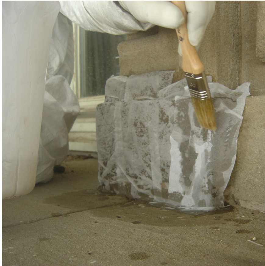
Consolidamento dei basamenti delle bifore del primo livello