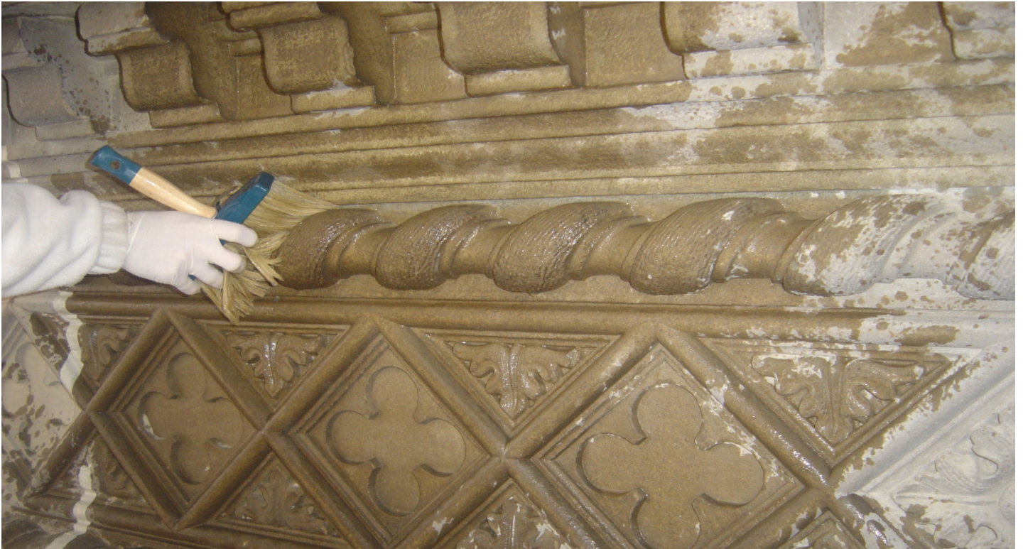
Pulitura ad acqua della zona del cornicione

Spolveratura della bugne della facciata operazione preliminare prima di qualsiasi tipo di trattamento