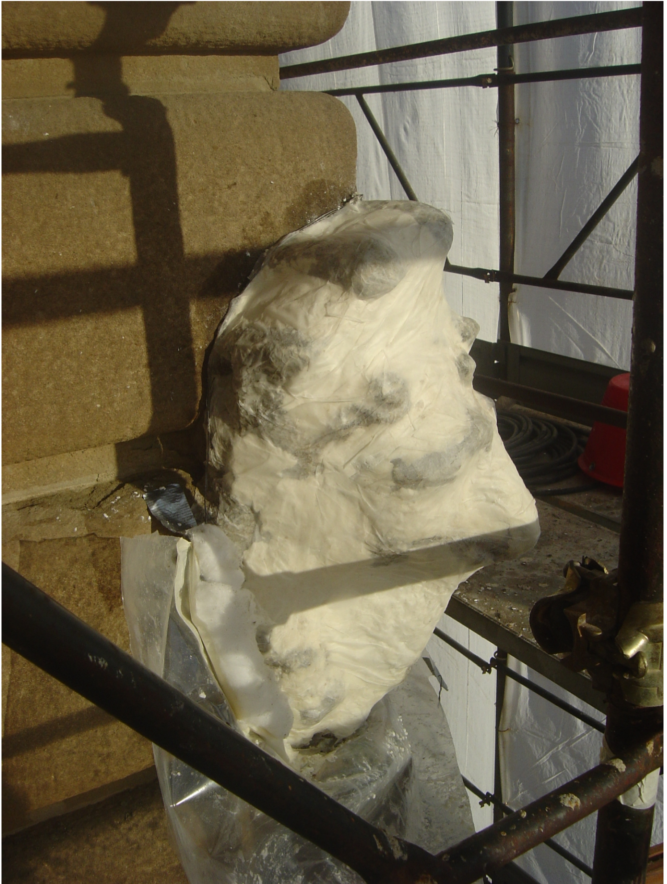
Vista del leone preparato per l'impacco consolidante