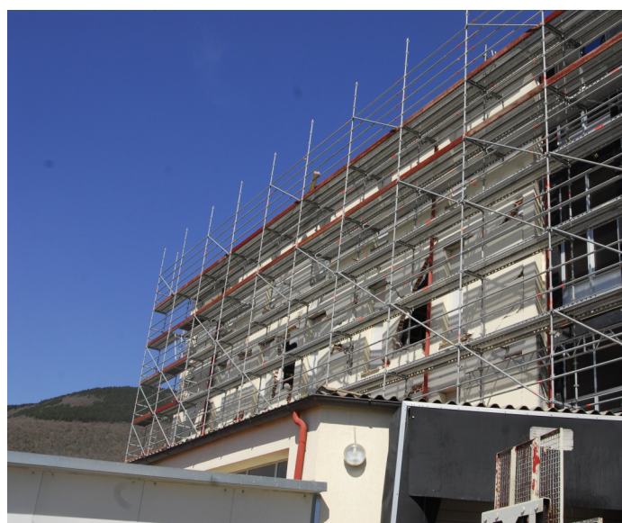
fasi di allestimento del canitere