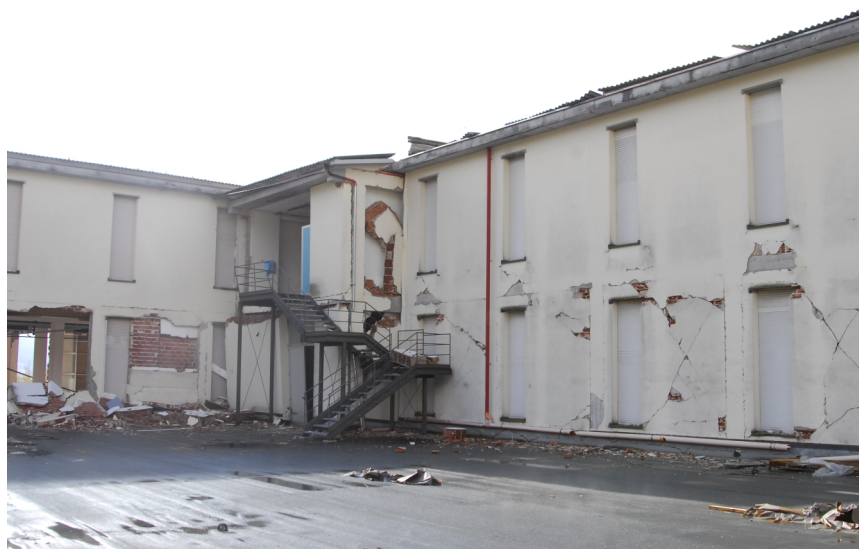
lo stabilimento dopo la crisi sismica

SUPEFICIE D'INTERVENTO 5000 mq ponteggio montato 4.500 mq tipologia del ponteggio multidirezionale LAYER