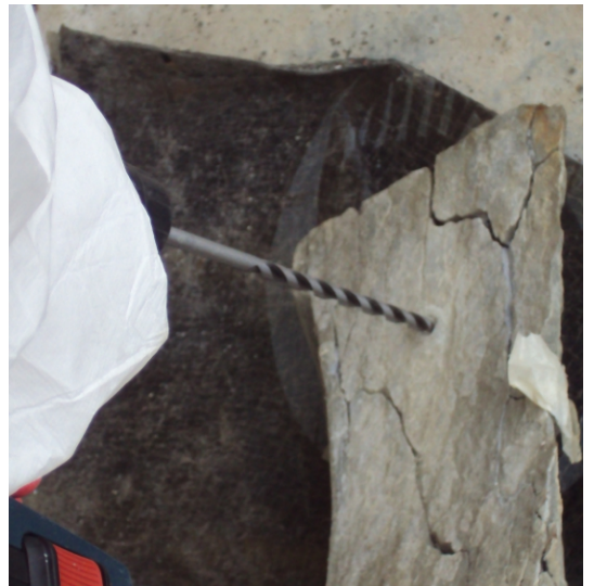
restauro dello stemma della facciata con dettaglio di tutte le fasi operative: a) riadesione delle scaglie b) stuccatura