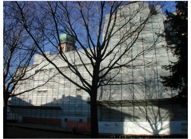
Il duomo di S. Vigilio in Trento circondato dalle impalcature, durante l'intervento di restauro