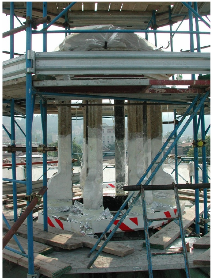
Sopra e sotto: due momenti durante il consolidamento dei montanti della lanterna della cappella del S.S. Crocefisso. Tale intervento è stato eseguito mediante impacco e percolazione di RC 80 (Rhoximat), fino a rifiuto