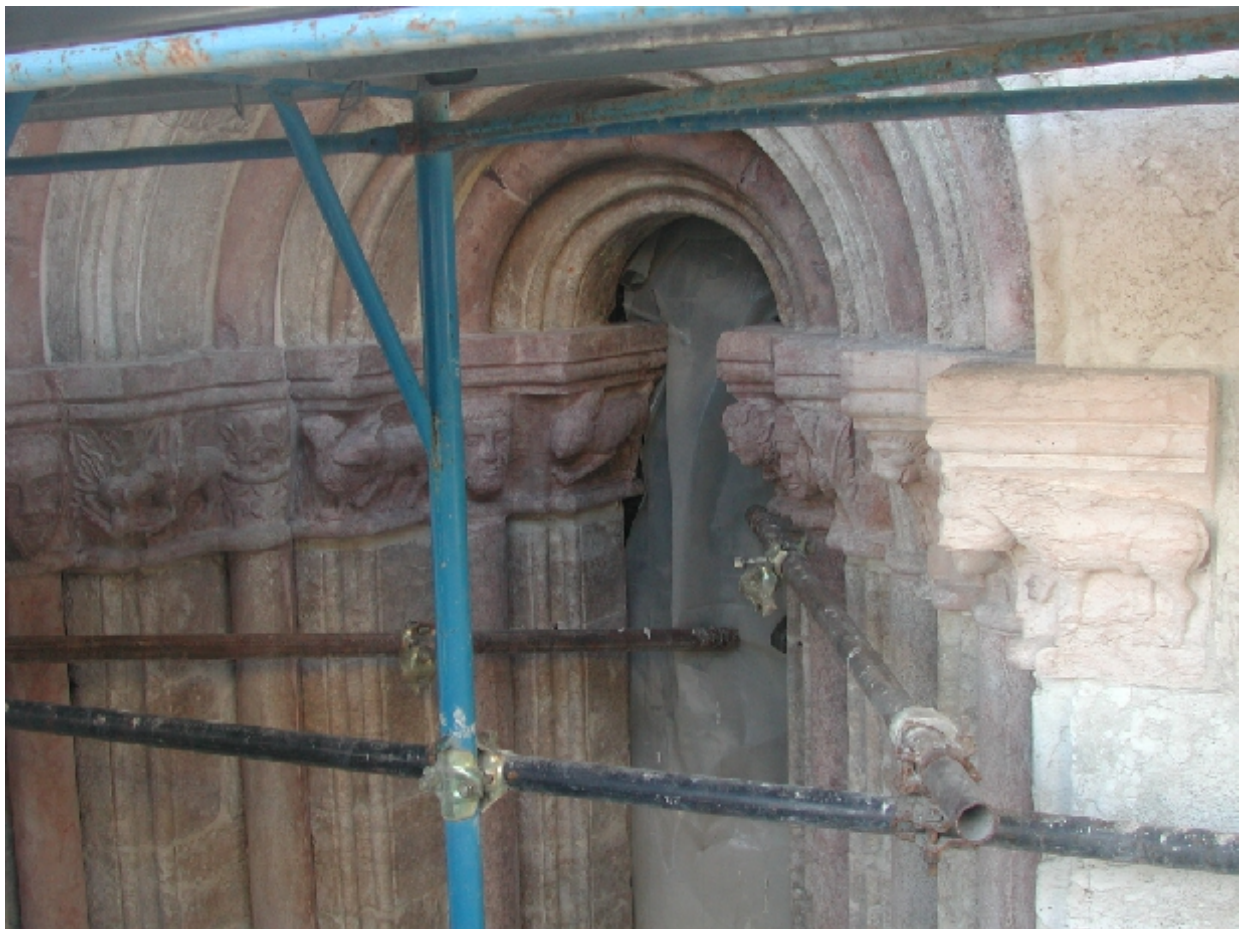
Vista finale dopo il consolidamento della monofora del campanile sul fronte nord