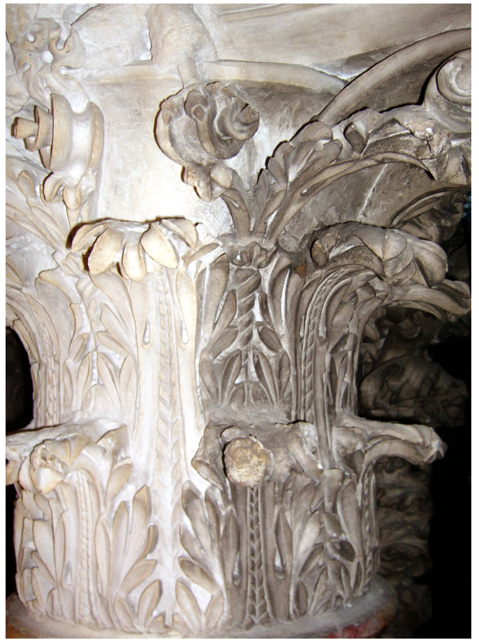
Modanato architettonico dopo la pulitura prima del ritocco