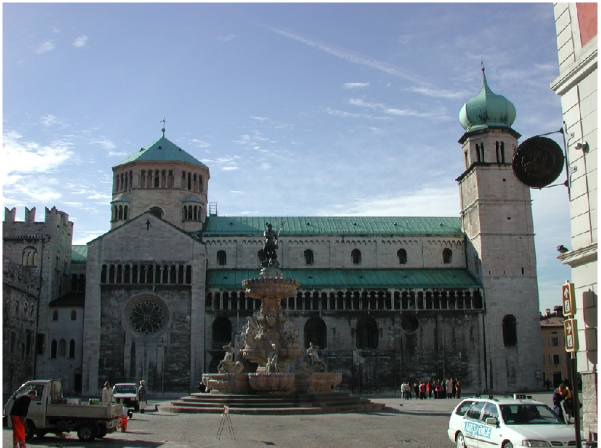
prima e dopo l'intervento