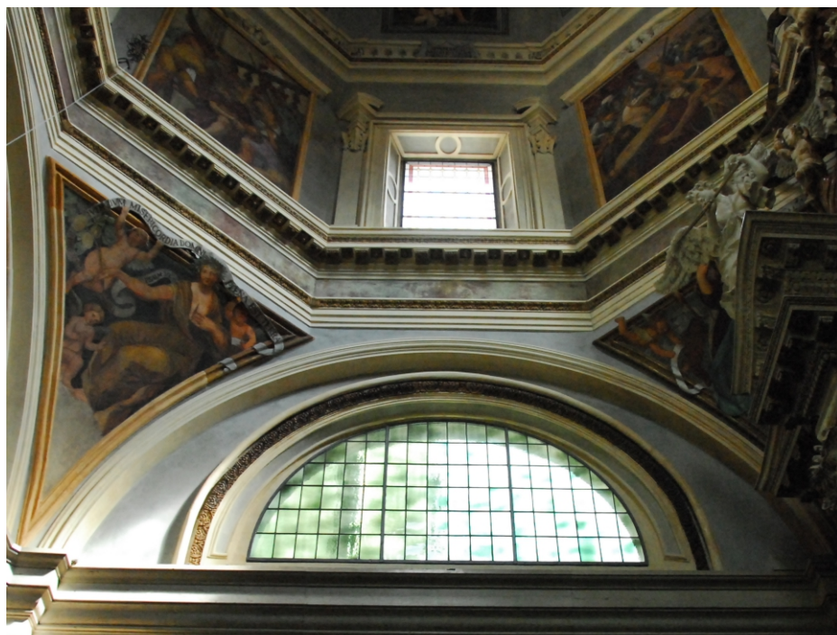
Intervento concluso dopo la riapertura al culto