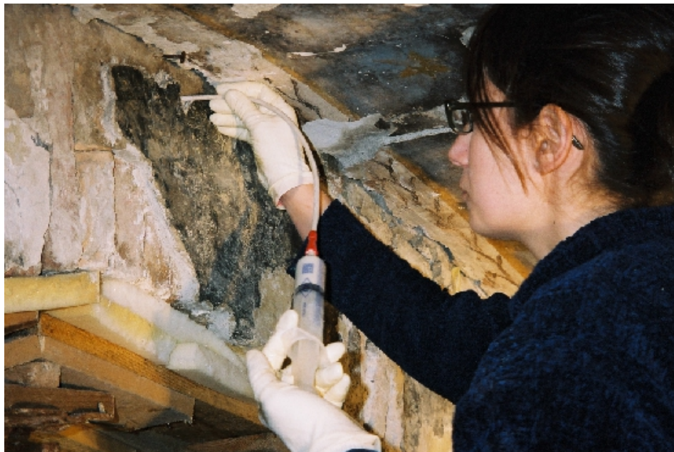
Operazione di consolidamento degli strati preparatori mediante iniezione