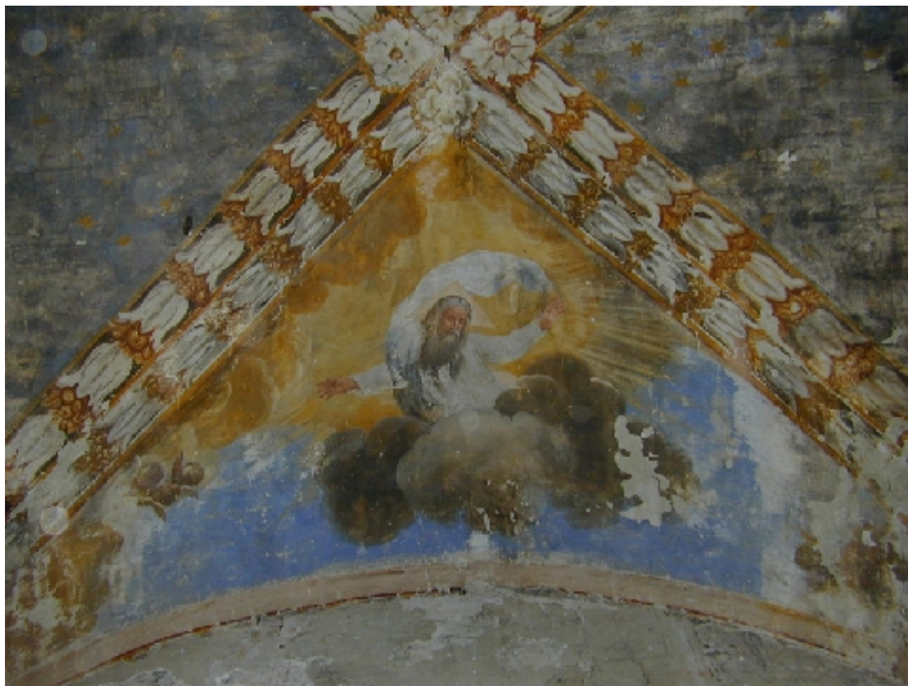
Vista delle decorazioni della volta Absidale