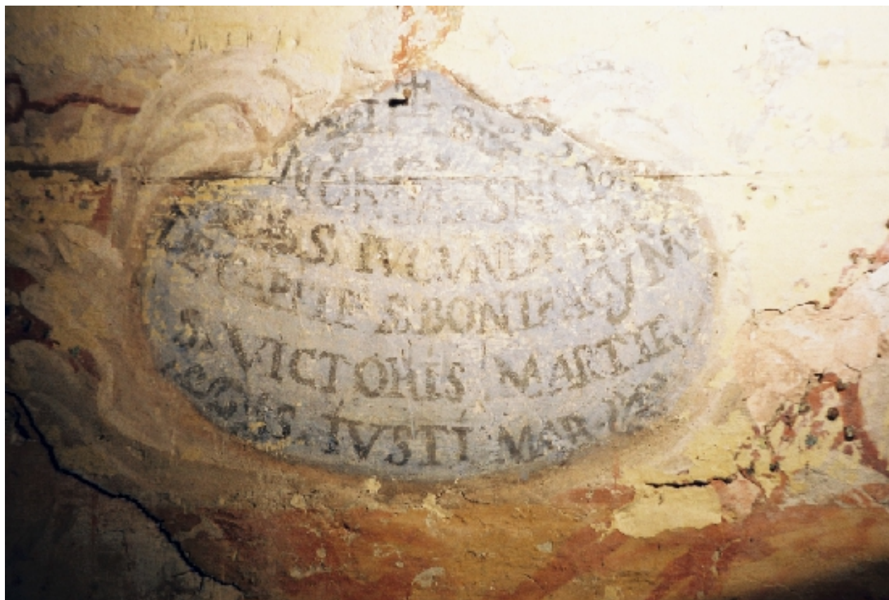
Particolare della decorazione sulla navata centrale dopo lo scoprimento