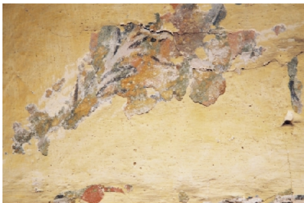
Successione delle fasi di descialbo delle decorazioni sulla zona della navata centrale

Cosolidamento della pellicola pittorica veicolata attraverso la carta giapponese dopo le operazioni di consolidamento e riadesione al supporto