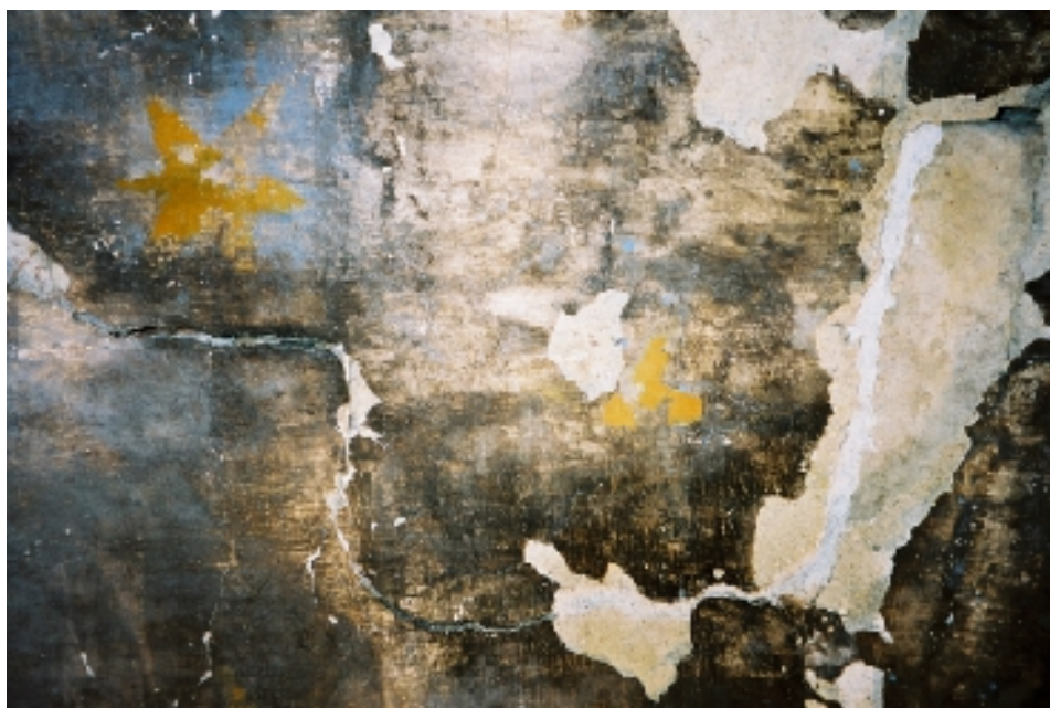
Particolare dei fondi della crociera dell'abside dopo le operazioni di fissaggio dei bordi e consolidamento degli strati preparatori