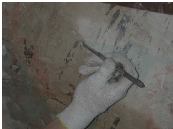
Operazioni di descialbo della sinopia della parete dell'abside, durante le operazioni di scopritura e la successiva vista finale