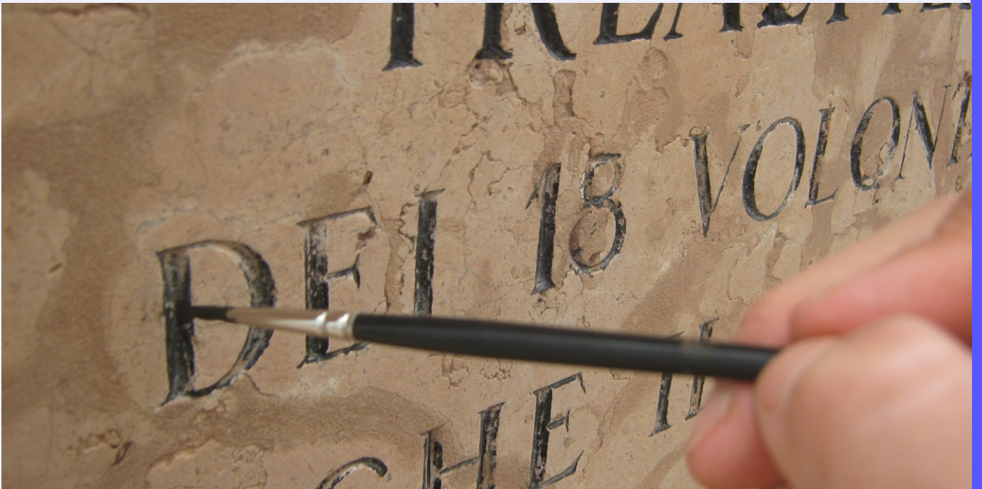
ritocco pittorico della scritta, per ricostruire l'integrità dell'immagine complessiva