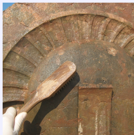
rimozione dell'attacco biologico con spazzolatura con setole morbide in nylon