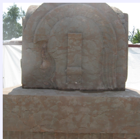
vista dopo l'intervento di pulitura e rifinitura con microsabbatrice