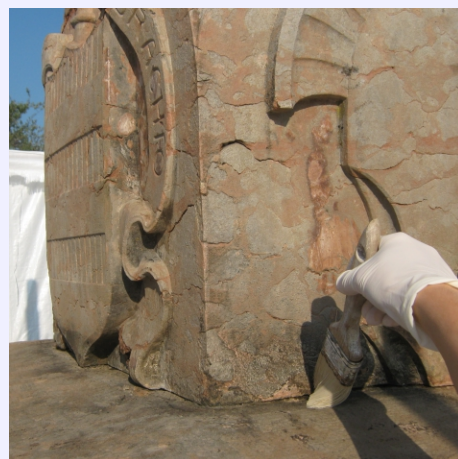
spolveratura della parte sommitale dell'obelisco