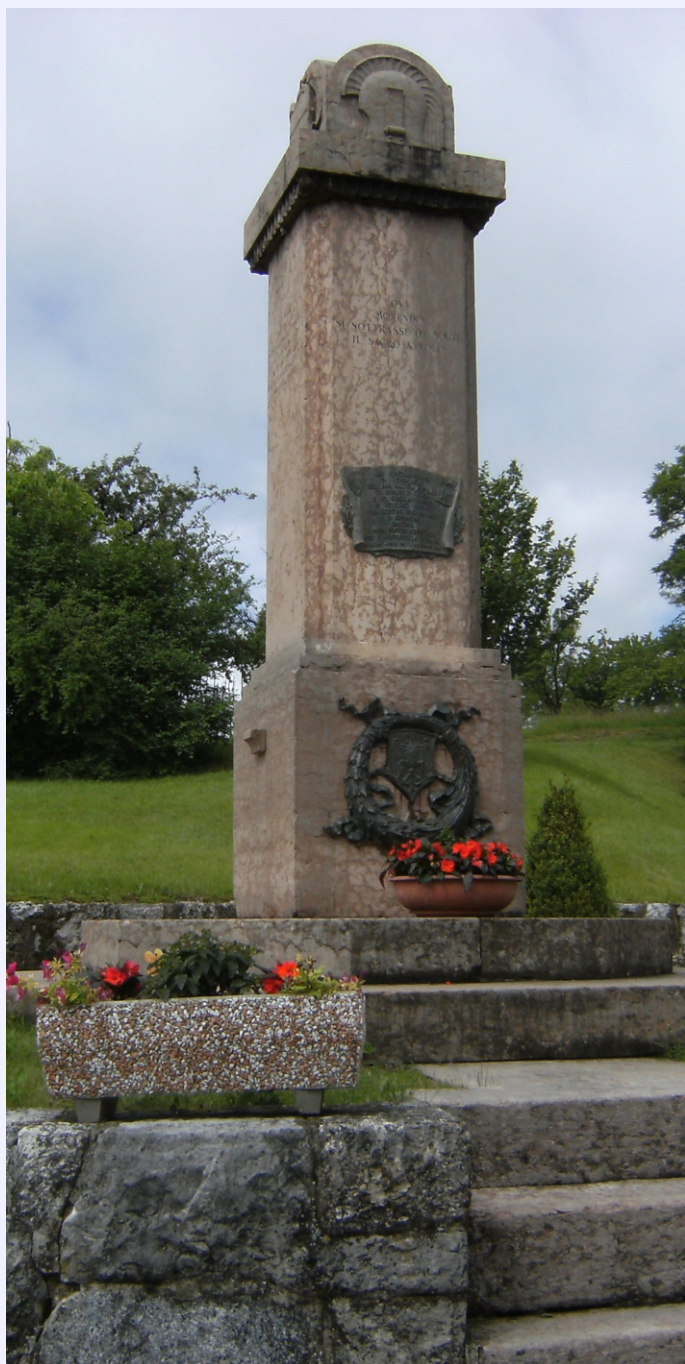
prima dell'intervento vista dell'obelisco